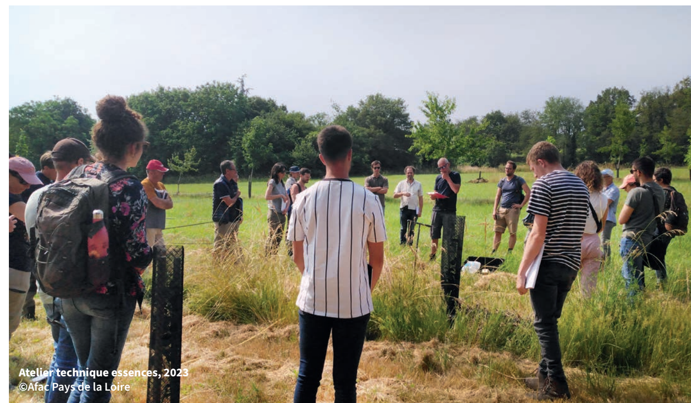
Atelier technique essences, 2023