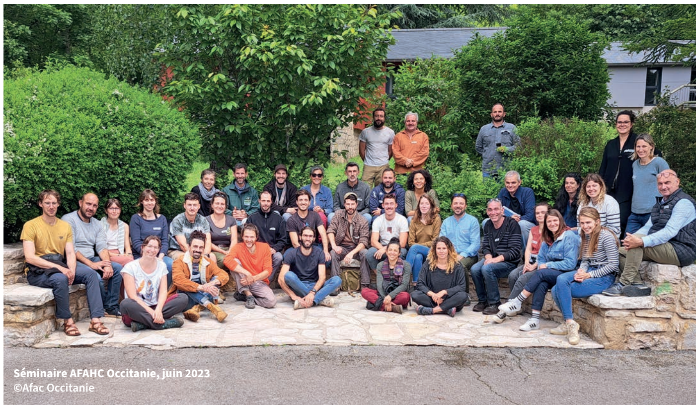
Séminaire AFAHC Occitanie, juin 2023