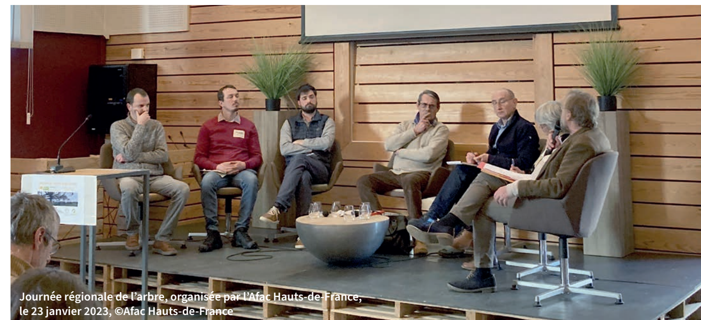
Journée régionale de l'arbre, organisée par l'Afac Hauts-de-France, le 23 janvier 2023, ©Afac Hauts-de-France