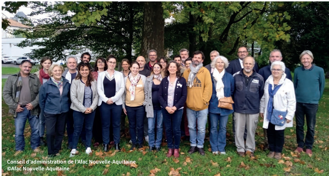
Conseil d'administration de l'Afac Nouvelle-Aquitaine