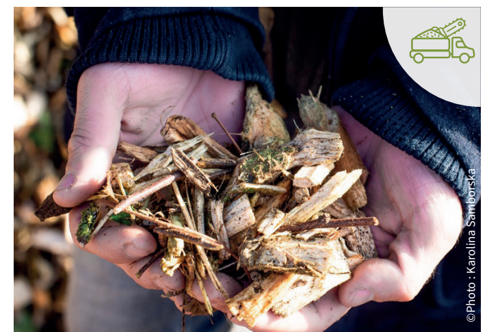
Filières aval de valorisation des produits directs et indirects issus de l'arbre et de la haie