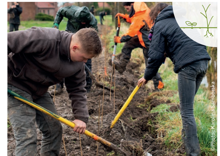
Plantation et régénération naturelle assistée (RNA)