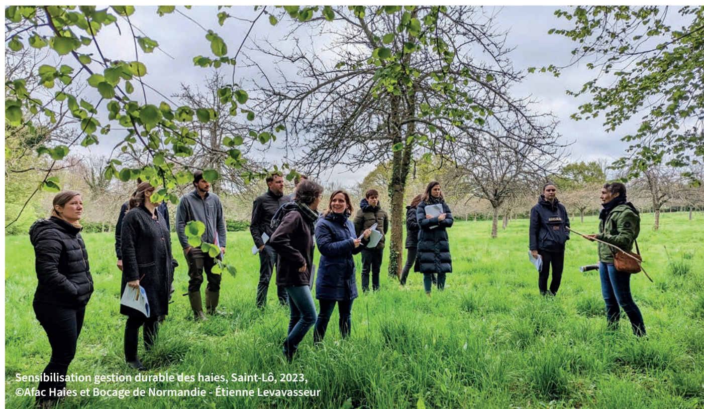
Sensibilisation gestion durable des haies, Saint-Lô, 2023, ©Afac Haies et Bocage de Normandie - Étienne Levasseur