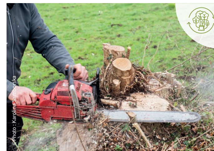
Restauration et gestion durable de l'arbre hors-forêt