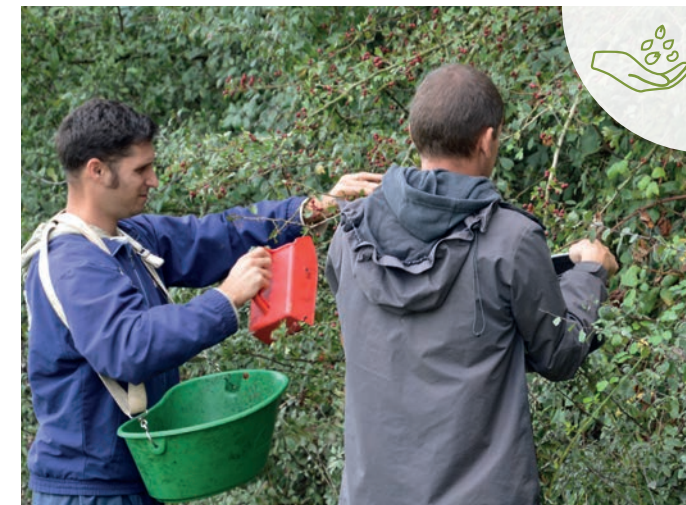
Filières amont de collecte de graines et de production de plants d'arbres et d'arbustes

Cette synergie d'approches complémentaires autour d'une vision commune de l'arbre est une richesse, elle permet de progresser collectivement tout en garantissant le caractère d'intérêt général des actions menées.