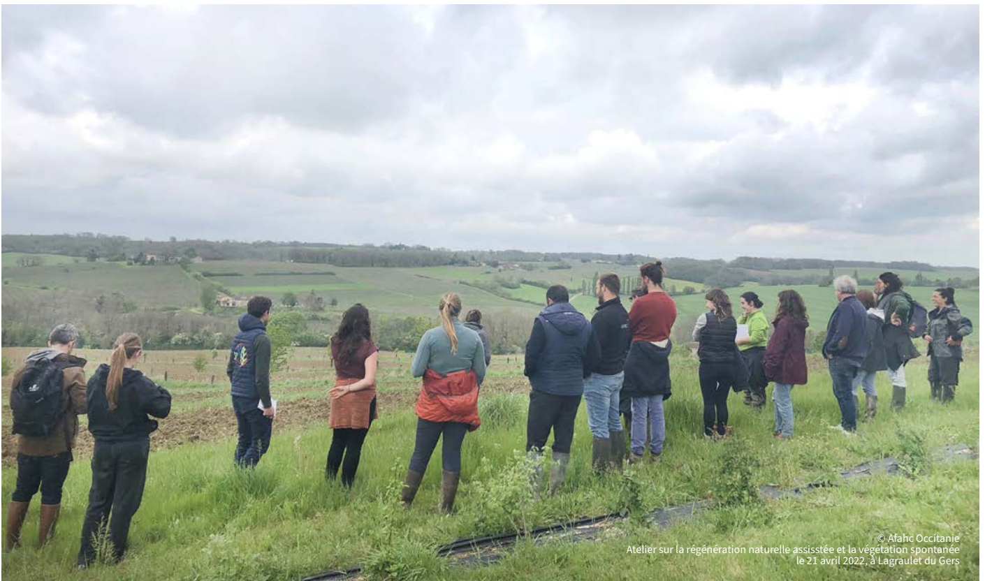
© Afac Occitanie Atelier sur la régénération naturelle assistée et la végétation spontanée le 21 avril 2022, à Lagraulet du Gers

En cohérence avec le projet associatif du Réseau Afac, chaque Afac régionale vise à promouvoir, accompagner et mettre en œuvre des politiques globales de développement de l'arbre hors forêt à l'échelle régionale dans une triple approche agricole, environnementale, et de développement territorial.