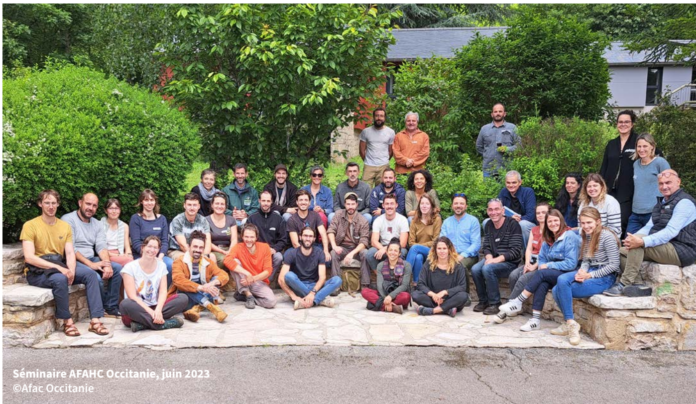
Séminaire AFAHC Occitanie, juin 2023