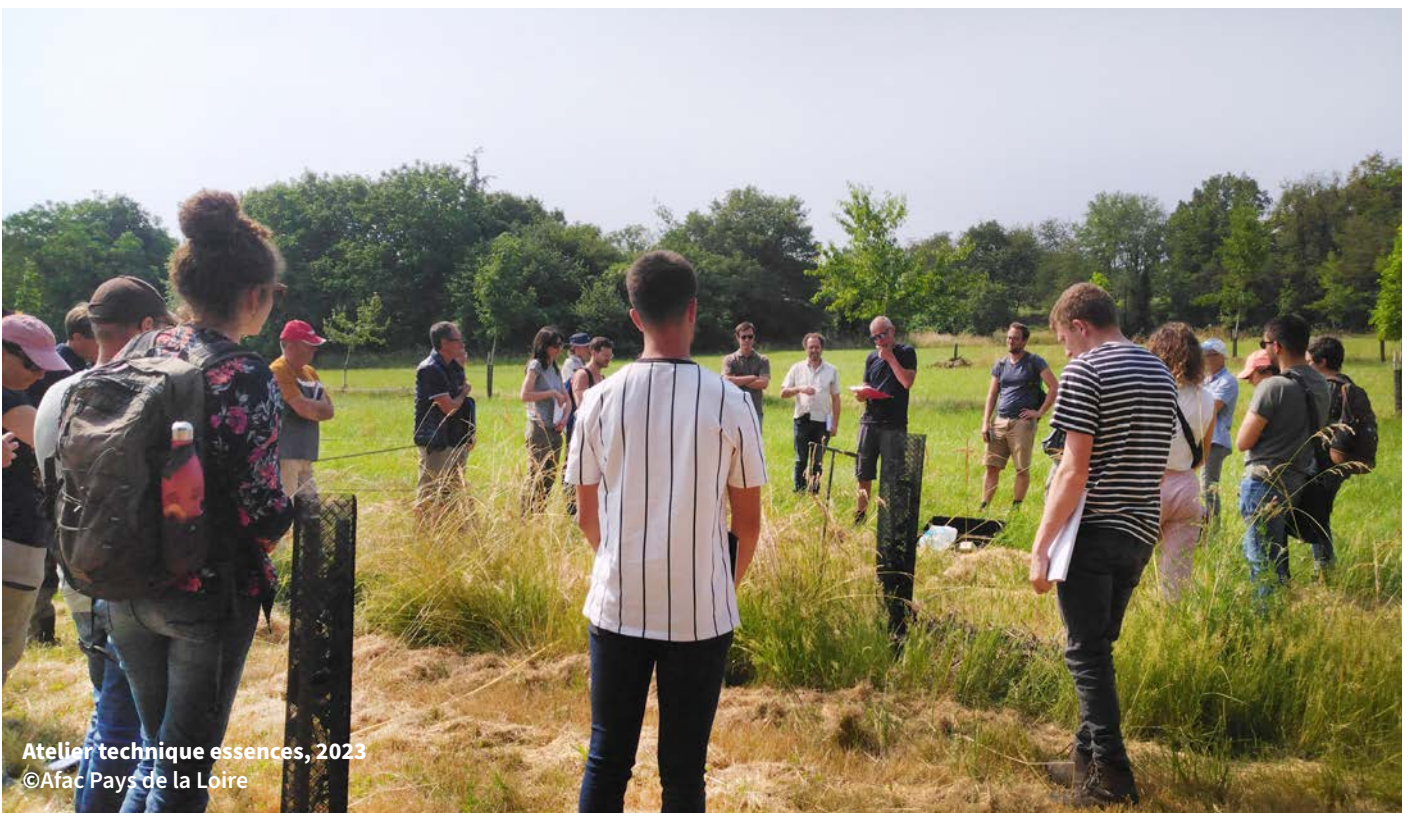
Atelier technique essences, 2023