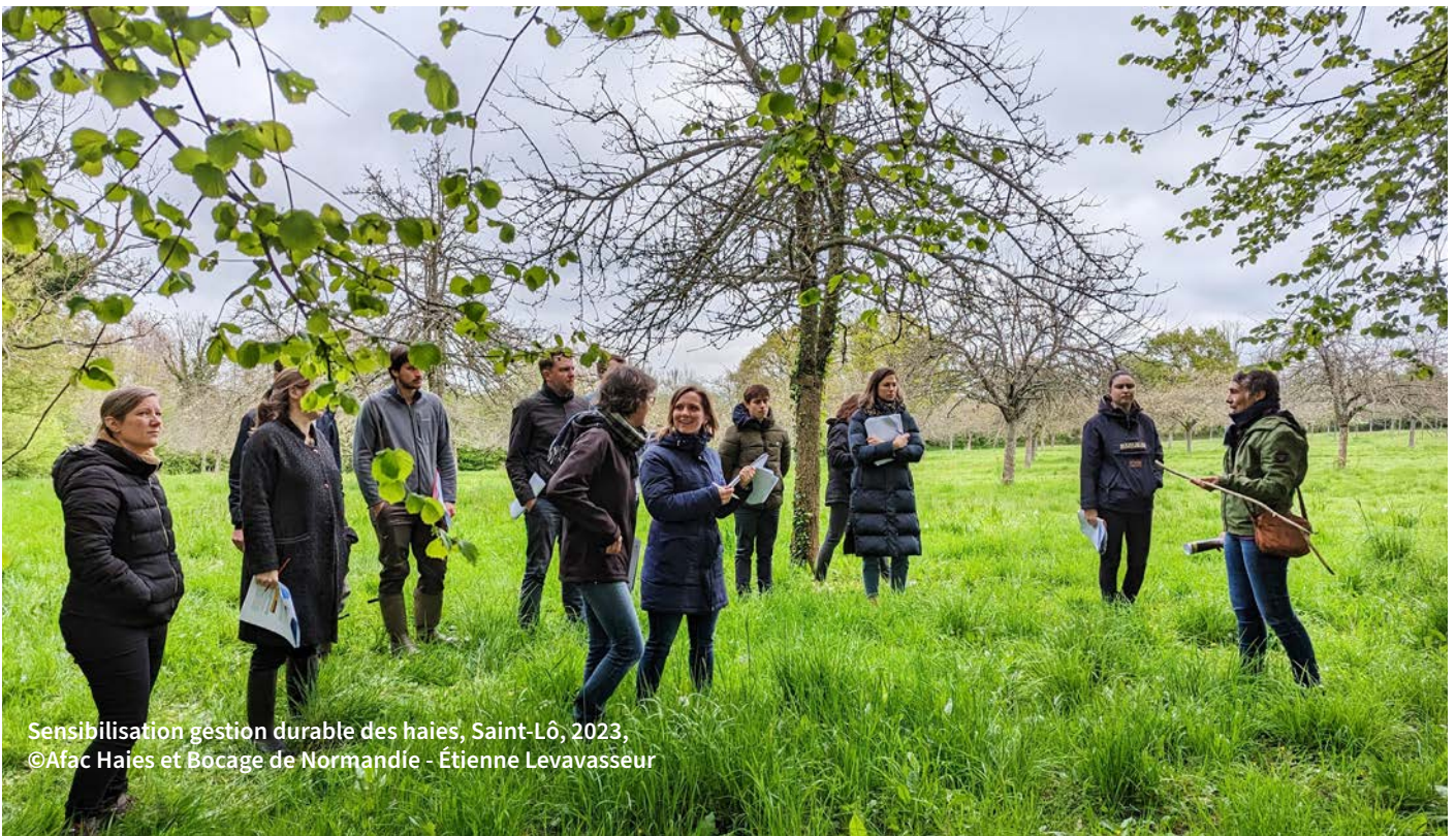
Sensibilisation gestion durable des haies, Saint-Lô, 2023