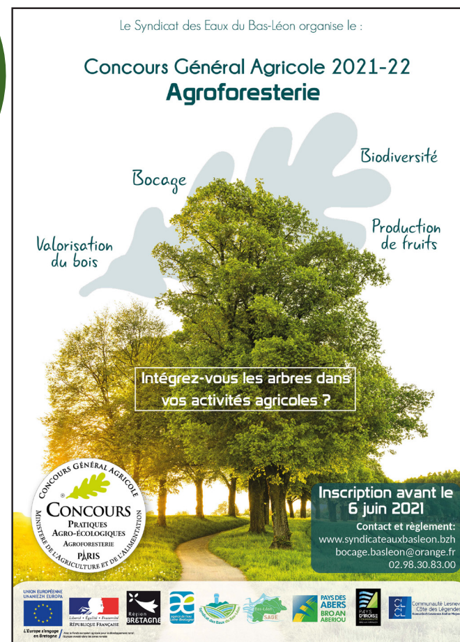
Bandeau et affiche du concours du Bas-Léon