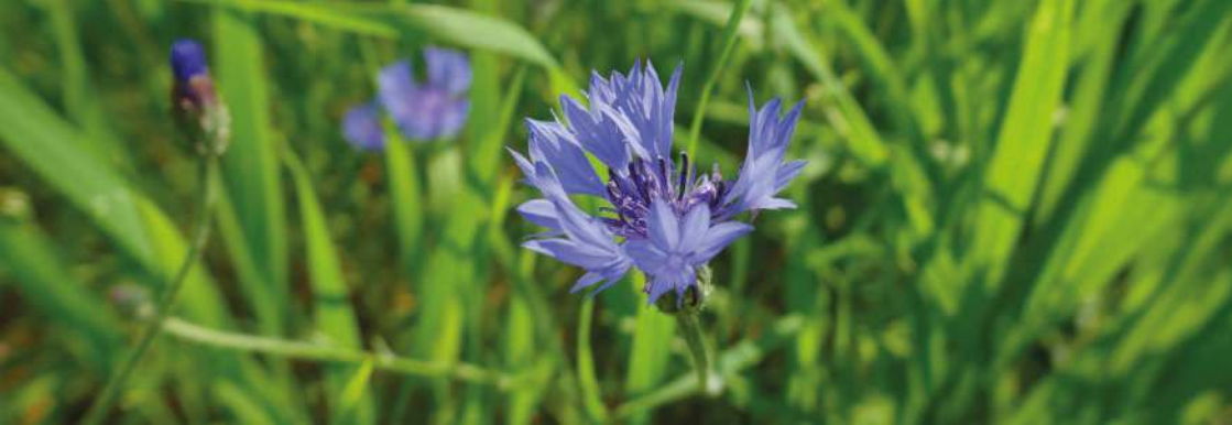
> Bleuet des champs ( Centaurea cyanus ) plante messicoles, très attractive pour les pollinisateurs.

La Fédération régionale des chasseurs d'Occitanie (FRCO), l'Association française pour l'Arbre et la Haie champêtre d'Occitanie (AFAHC Oc), Le Conservatoire botanique national des Pyrénées et de Midi-Pyrénées (CBNPMP), la Ligue pour la protection des oiseaux Aveyron (LPO 12), ont le plaisir de vous inviter à trois demi-journées de restitution de leurs programmes menés dans le cadre de la Trame Verte et Bleue, les :