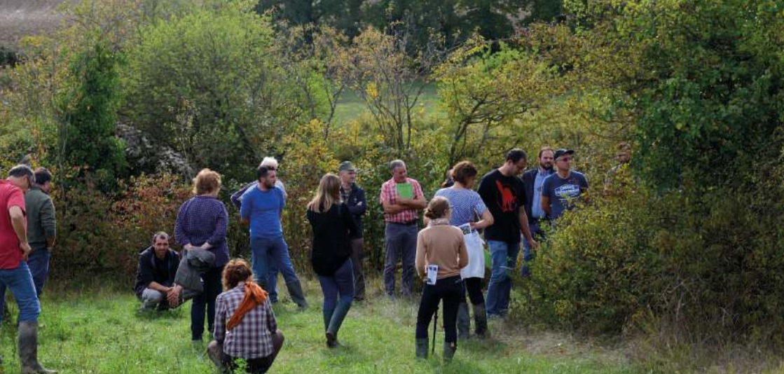
> Visite de ferme pilote dans le cadre du programme CORRIBIOR

« CORRIBIOR », « Messiflore » et le programme de « Conseils et accompagnement pour la mise en oeuvre de mesures en faveur de la biodiversité » sont trois programmes distincts, partageant une stratégie commune mise en oeuvre pour développer des modes de gestion favorables à la préservation ou à la restauration de la sous-trame milieux ouverts de la Trame Verte et Bleue et pour accompagner les acteurs du territoire.