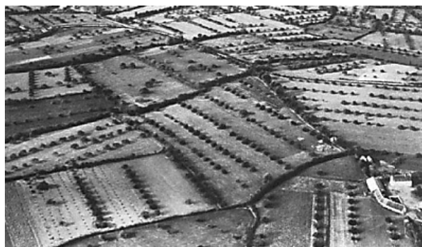
Le bocage agroforestier dans le Perche de l'Eure-et-Loir, près de Nogent-le-Rotrou en 1950

A 2 R C 13 avenue des droits de l'Homme 45921 Orléans Cedex