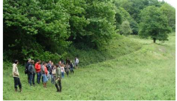
Cours théoriques sur le terrain