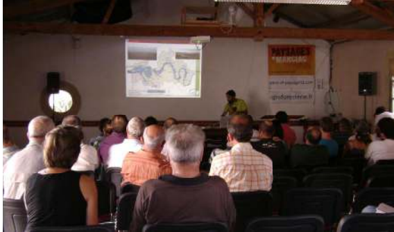
Cours théoriques en salle

en groupes modeste pour un meilleur accompagnement et garantir les résultats