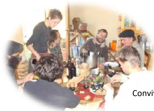
Convivialité constructive des repas partagés

Tarif professionnels 150 €/jours (170 €/jours si prise en charge par VIVEA ou le FAFSEA) Particuliers 70 € / jours, une réduction sera appliquée en fonction du nombre de jours 10 personnes maximum, la priorité sera donnée aux personnes participant à toutes les journées