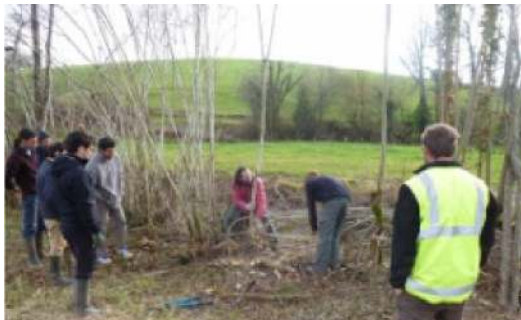
Mise en application par la pratique