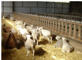
Brebis sur litière plaquettes litière sèche, pas de boiterie aucun problème pour la laine