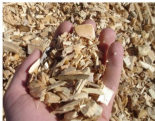
Plaquettes de petites tailles