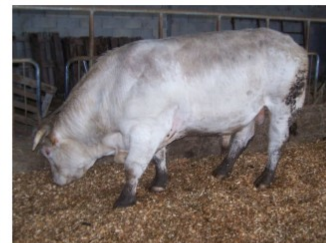
Taureau Charolais sur aire raclée les plaquettes absorbent les jus, couche antidérapante