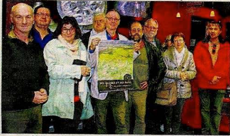
Un film et un débat organisés par l'ARBRE et les écrans de Gournay

Réalisé par Jean-Yves Ferret, à qui l'on doit déjà « La bergère et l'orchidée » sorti en 2011, le documentaire intitulé « Des racines et des haies » était projeté au cinéma des écrans de Gournay, mardi 22 septembre. Une soirée suivie d'un débat, en partenariat avec l'ARBRE, association rurale brayonne pour le respect de l'environnement. La salle de cinéma était comble, le public brayonnais restant très attentif à la sauvegarde du paysage de sa région. Surtout lorsque l'on parle, comme dans ce film, de bocage normand où la haie n'est pas seulement un décor, mais un lieu indispensable à la vie de la faune