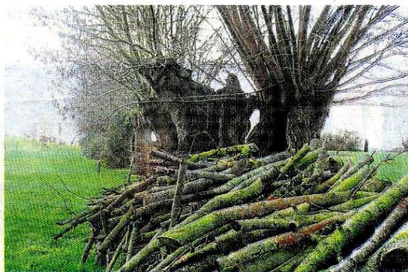
Les haies brayonnes peuvent être transformées en énergie

Ce message, l'Arbre continue de le porter, avec quelques succès puisque certains maires ont pris des arrêtés anti-arrachage et qu'une fi-