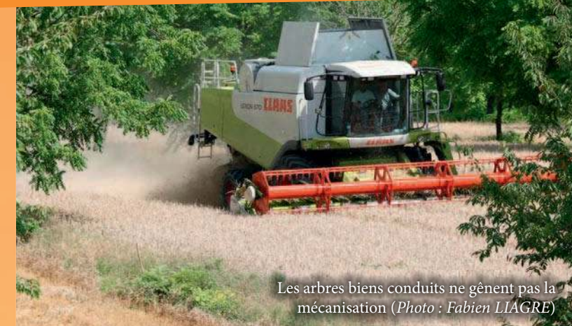
Les arbres bien conduits ne gênent pas la mécanisation

Page 4 • Second Pilier de la PAC • Pour une mesure nationale «Arbres et haies champêtres» • Intégration de l'arbre dans les autres mesures nationales